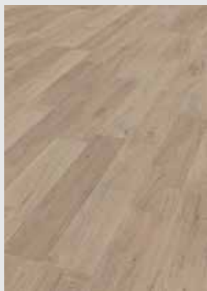
Studio Oak K071

Lamella Classic on paksuudeltaan 8mm, käyttöluokitus AC4 / 32, joten se soveltuu kaikkien kodin kuivien tilojen lisäksi myös julkisiin tiloihin. Runko on kosteussuojattua HDF levyä, ponttijärjestelmänä näissä on helppo ja nopea 1click2go-Pure, 20 vuoden takuulla. Neljä kuosia on ilman reunaviisteitä ja neljässä on viisteet jokaisella sivulla.