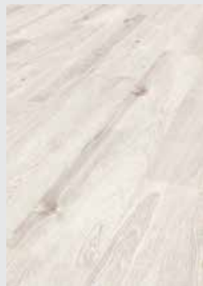
Skydive Oak K396