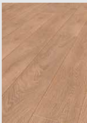
Light Brushed Oak 8634