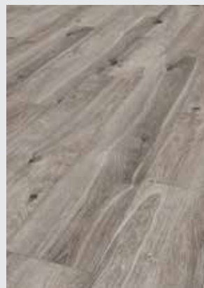
Tornado Oak K395