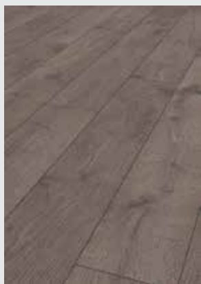
San Diego Oak 8096