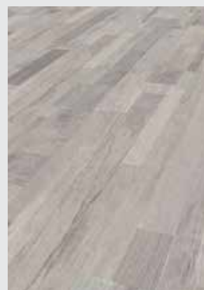
Silverside Driftwood K039