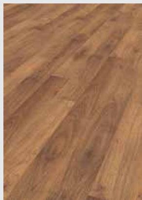
Classic Oak 6952